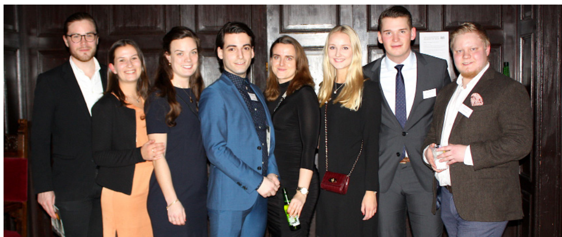
Bilder från årets kick off på Snerikes nation